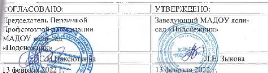
График работы работников МАДОУ ясли-сад «Подснежник»